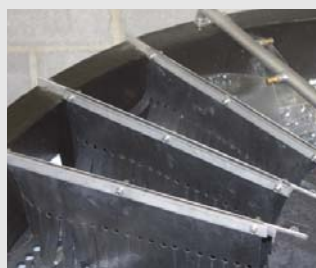
7) Het bestek passeert vervolgens de droogmatjes