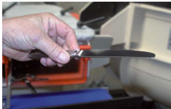
Het vuil bestek komt opnieuw proper en glanzend uit de machine en dit na slechts 10 minuten