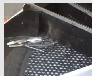
8) Daarna wordt het bestek door een droogtunnel gestuurd