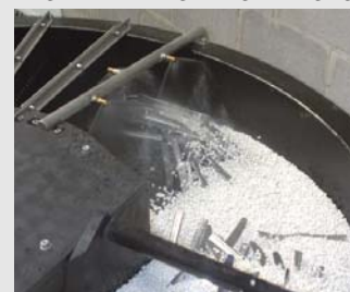
6) Tijdens de neutralisatiefase wordt er gespoeld met water