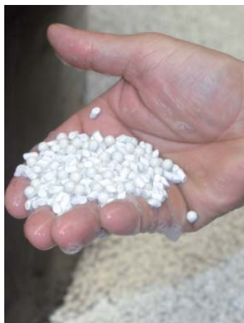
De keramische korrel verwijdert alle vuil van het bestek