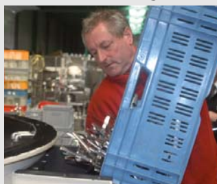
1) Het vuil bestek wordt in de machine gegoten