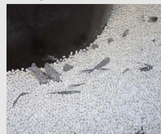
2) De keramische korrel schuurt en verwijdert het eerste vuil