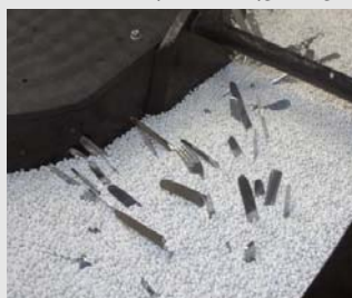
5) Het bestek wordt ongeveer 5 minuten gewassen