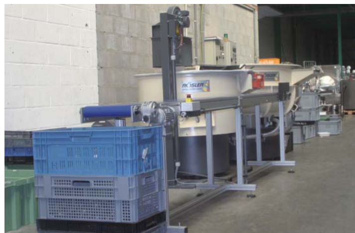
De afwasmachine van Rösler bevindt zich op een centrale plaats in het atelier

Leon Timmermans: “Wij hebben de afwasmachine geïnstalleerd in ons eerste bedrijfspand omdat we hier voldoende ruimte hadden. Daarnaast staat de machine op een centrale plaats en kunnen onze klanten met eigen ogen zien hoe het bestek wordt gereinigd en wat het resultaat is. Toch hebben we plannen om een volledige ruimte uit te bouwen als afwasruimte om nog gemakkelijker te kunnen werken.