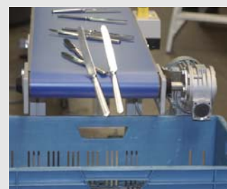
12) Na ongeveer 10 minuten is een hele bak vuil bestek weer proper