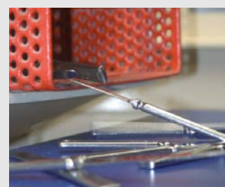
10) Na het drogen komt het bestek op de afvoer- en sorteerband terecht