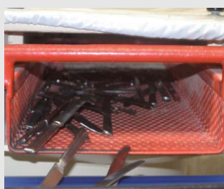
9) Tijdens het drogen wordt het bestek vlek-vrij gepoleerd