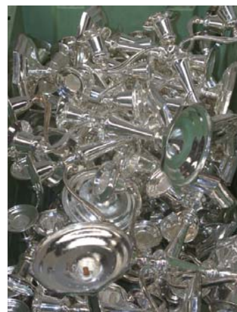
De afwasmachine leent er zich perfect toe om alle zilver op te poetsen