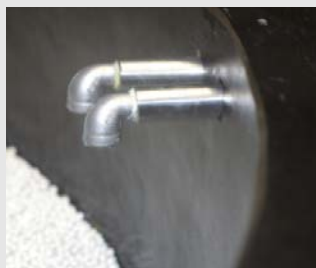
3) Daarna wordt via twee kraantjes water en afwasproduct bijgevoegd