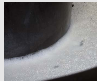
4) Het afwasproduct en de korrel zorgen voor een grondige reiniging